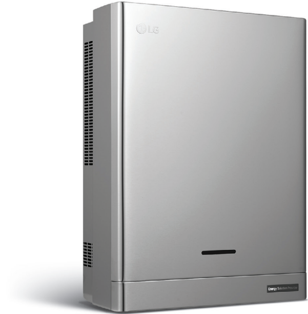
PCS (D008KE1N211) (D010KE1N211)

System Monitoring ermöglicht erhöhten PV-Eigenverbrauch für mehr Unabhängigkeit. Kompatibilität mit LG-Wärmepumpe Mono-Bloc