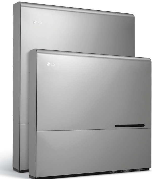
Batterie (BLGRESU7H) (BLGRESU10H)